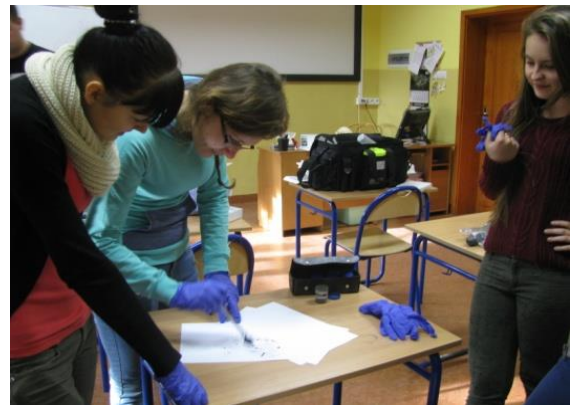
Zajęcia z technikiem kryminalistyki