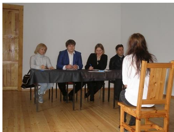
Symulacja rozmowy kwalifikacyjnej