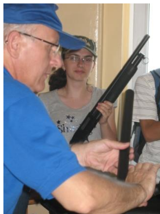
Zajęcia na strzelnicy