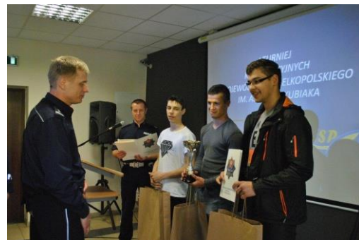
rok 2013/2014 II miejsce drużynowo, II indywidualnie