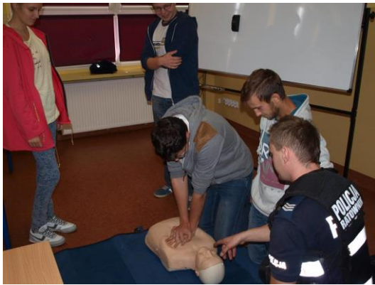
Zajęcia z pierwszej pomocy przedmedycznej