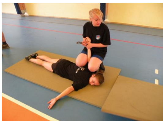
Zajęcia z kajankowania

Uczniowie tego kierunku angażowani są w Wolontariat oraz różnego rodzaju akcje profilaktyczne. Największym zainteresowaniem cieszą się wyjazdy na przystanek PaT .