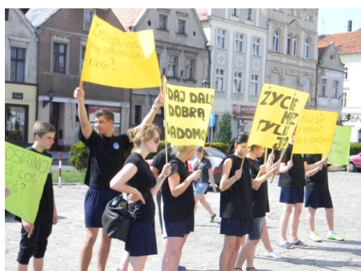
Akcja profilaktyczna w Rawiczu