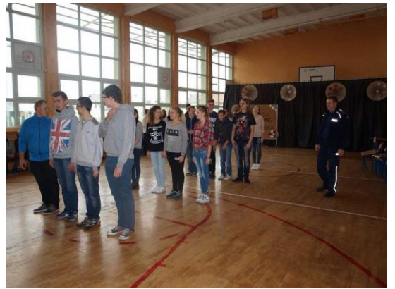
Zajęcia z muzyki