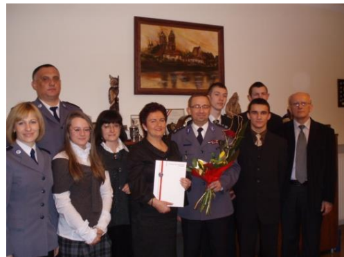
Uroczyste podpisanie umowy partnerskiej w Komendzie Wojewódzkiej Policji w Poznaniu