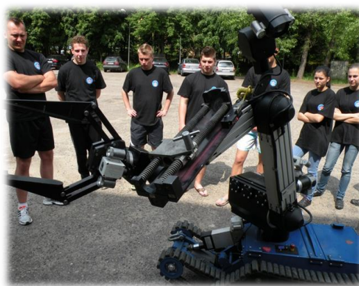
Zapoznanie z pracą robota pirotechnicznego