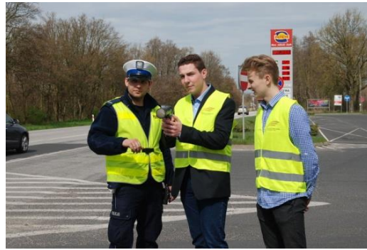
Nagroda główna konkursu- dzień w roli Komendanta

Od roku szkolnego 2013/2014 nasi mundurowi sprawdzają swoje umiejętności podczas Turnieju Klas Policyjnych Województwa Wielkopolskiego im. asp. Jana Kubiaka organizowanego w Jarocinie, zajmując czołowe miejsca.