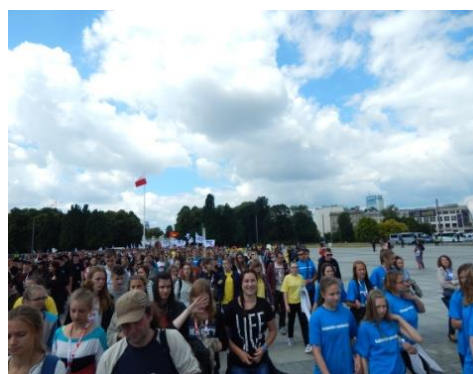
X Ogólnopolska akcja profilaktyczna- PaT- Warszawa