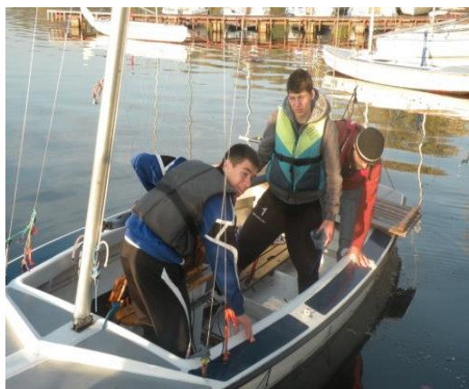
Zajęcia z żeglarstwa

Ponadto corocznie uczniowie klasy II uczestniczą w obozie szkoleniowym w Kiekrzu .