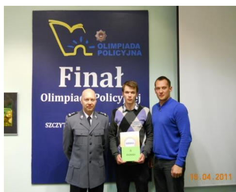
Finalista Olimpiady Policyjnej w Szczytnie