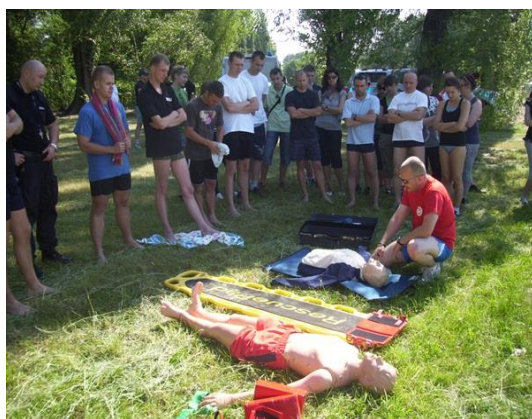
Zajęcia z Komisariatem Wodnym