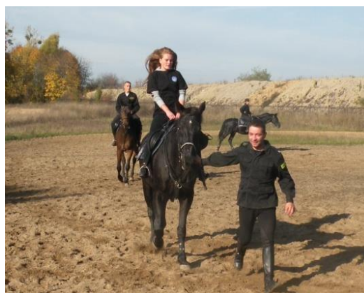
Zajęcia w Ogniwie Konnym

Dla uczniów klas trzecich organizowany jest trening kompetencyjny , czyli przygotowanie kadetów do rozmowy kwalifikacyjnej, a także zajęcia sprawnościowe.