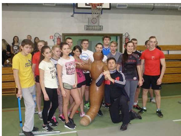
Zajęcia sprawnościowe z funkcjonariuszem Policji

Dla uczniów klas trzecich organizowany jest trening kompetencyjny , czyli przygotowanie kadetów do rozmowy kwalifikacyjnej, a także zajęcia sprawnościowe.