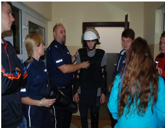
Zajęcia w Komendzie Powiatowej Policji w Rawiczu.