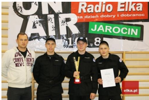
rok 2014/2015 III miejsce drużynowo

Od roku szkolnego 2013/2014 nasi mundurowi sprawdzają swoje umiejętności podczas Turnieju Klas Policyjnych Województwa Wielkopolskiego im. asp. Jana Kubiaka organizowanego w Jarocinie, zajmując czołowe miejsca.